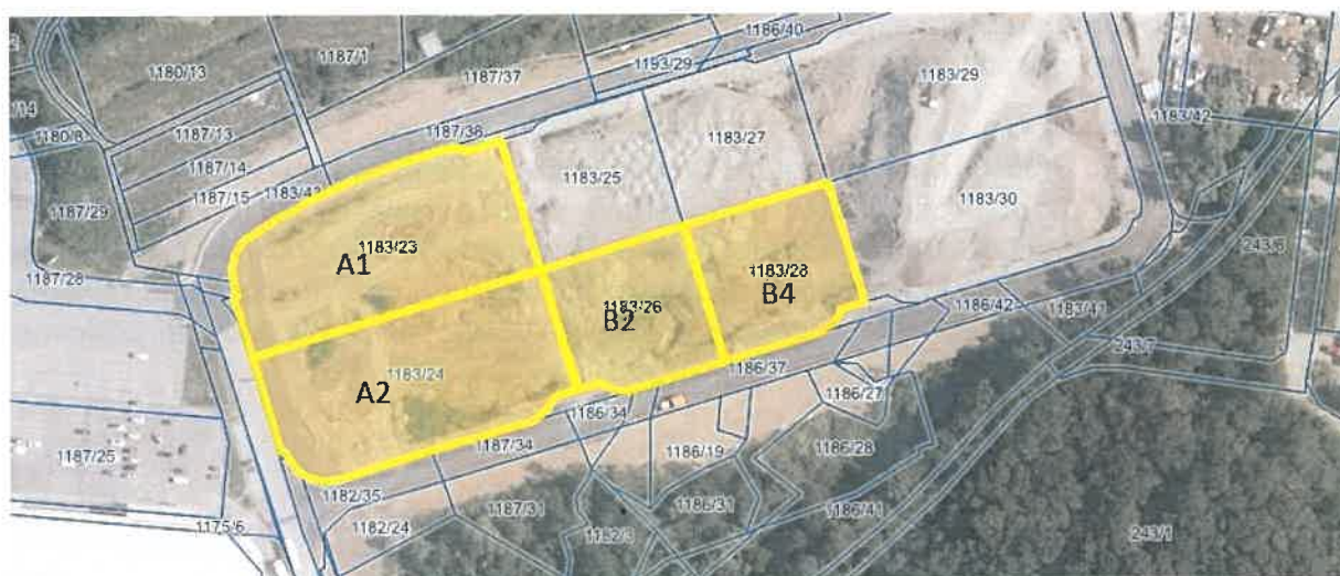
Slika 2: Predmeta prodaje

Kupec bo moral v okviru pridobitve gradbenega dovoljenja za poslovne objekte plačati tudi pripadajoči komunalni prispevek v skladu z veljavno zakonodajo. Možnost subvencioniranja