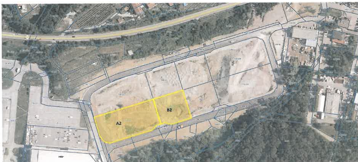
Slika 2: Predmeta prodaje

Kupec bo moral v okviru pridobitve gradbenega dovoljenja za poslovne objekte plačati tudi pripadajoči komunalni prispevek v skladu z veljavno zakonodajo. Možnost subvencioniranja komunalnega prispevka v višini 50 % ob prijavi na Javni razpis za sofinanciranje stroškov komunalnega prispevka Mestne občine Nova Gorica.